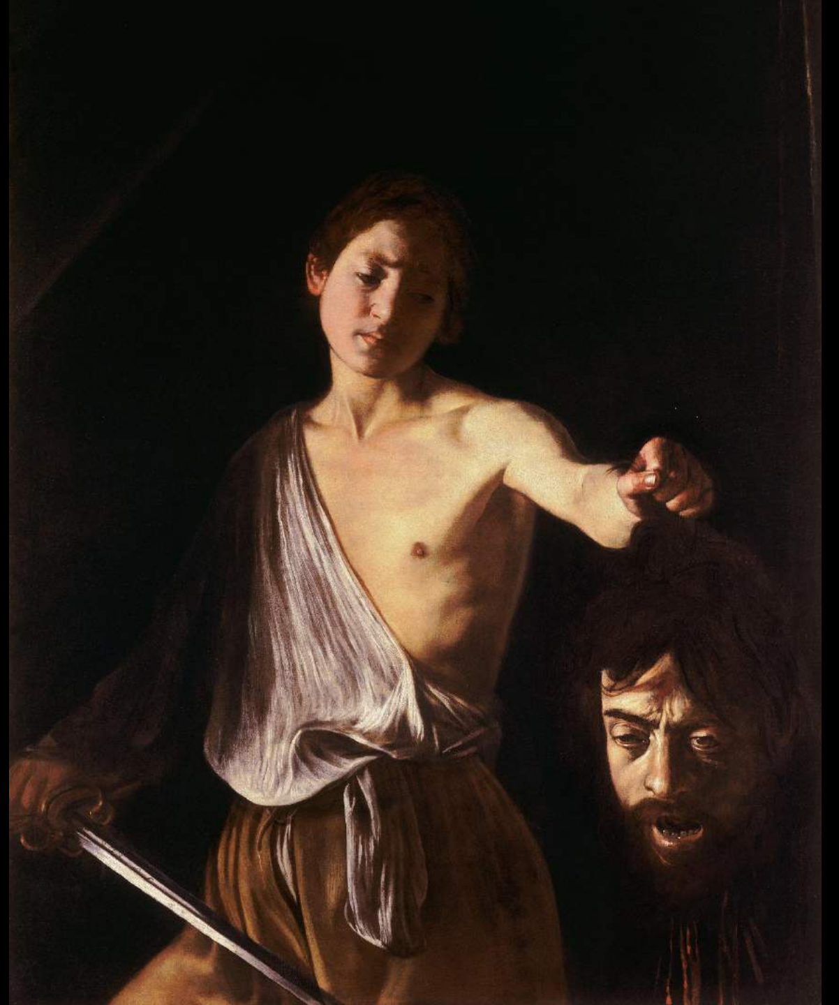
Caravaggio, Davide con la testa di Golia, 1609-10, Olio su tela, 125 x 101 cm, Galleria Borghese, Roma