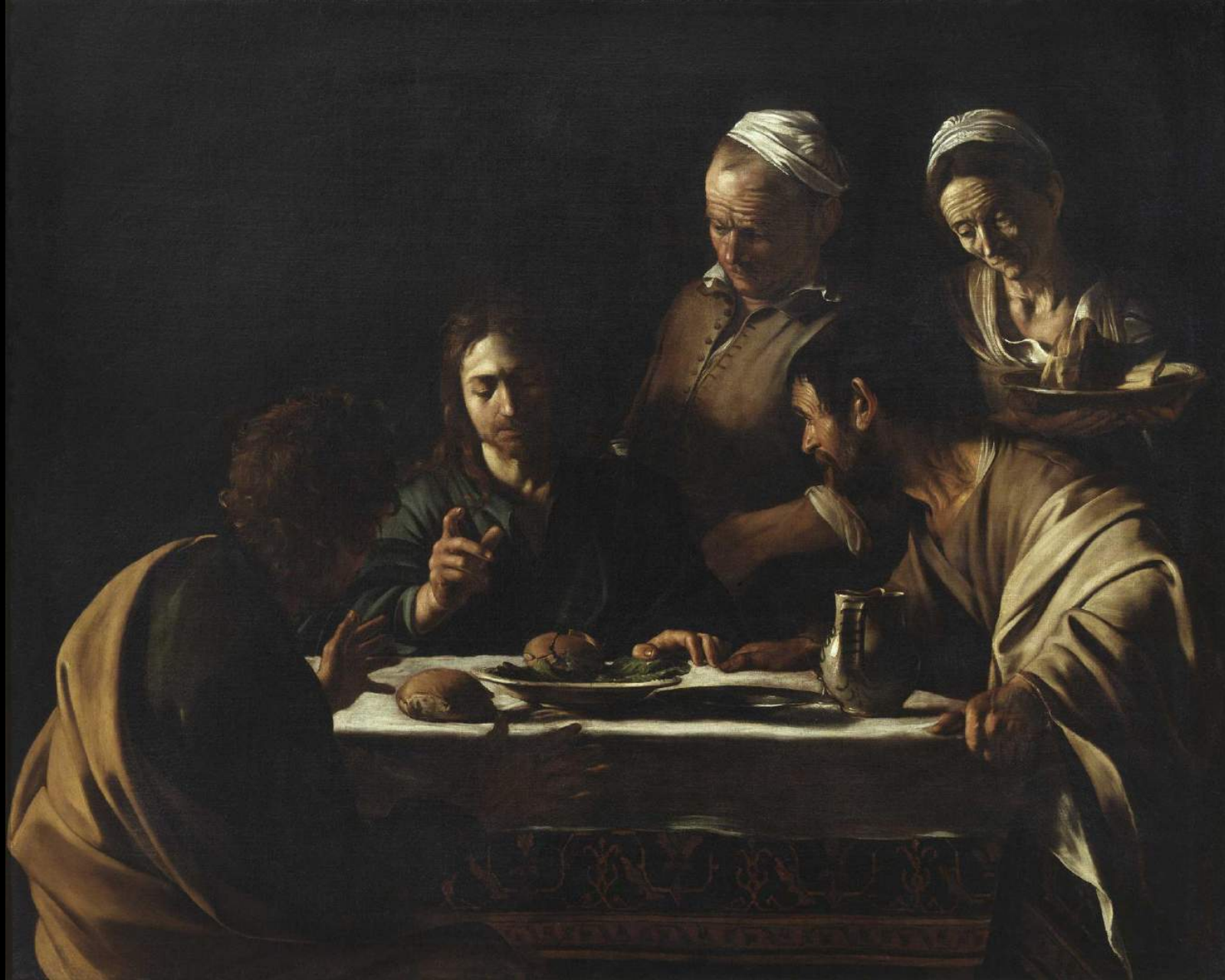
Caravaggio, Cena in Emmaus, 1606, Olio su tela, Milano, Pinacoteca di Brera